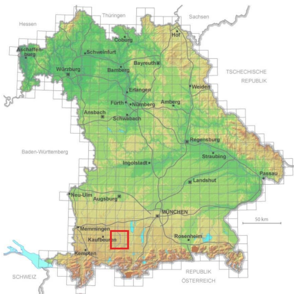
Abb. 1: Lage des Untersuchungsgebiets in Bayern Raster = Kartenblätter der TK 25

Das Untersuchungsgebiet liegt rund 20 km südlich von Landsberg auf der Westseite des Lechs zwischen den Ortschaften Kinsau im Norden und Schongau im Süden (Abb. 3). Die Lage im Kartengitter der TK 25 ist in den Abbildungen 1 und 2 dargestellt. Der Eingriffsbereich (grün) liegt im Kartenblatt 8131 (Schongau) und erstreckt sich über alle 4 Quadranten.