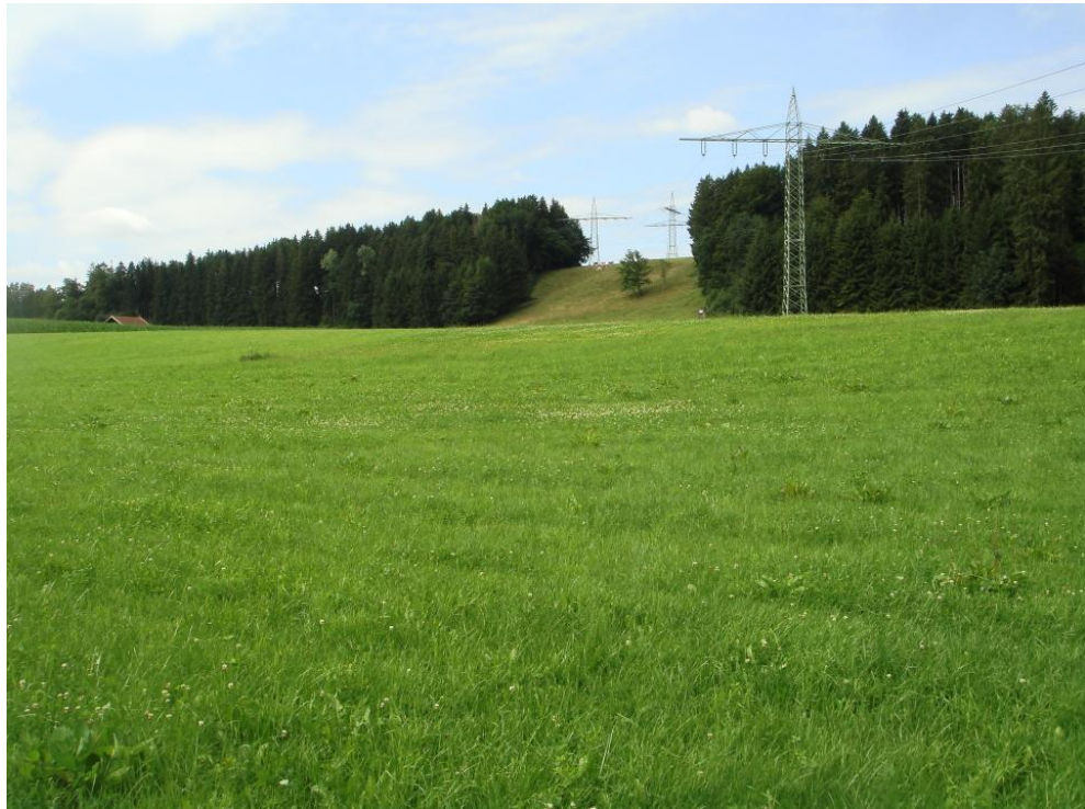
Foto 23 Abschnitt nordöstlich von Hohenfurch, Blickrichtung Südwest, 29.07.2021: im Vordergrund Fettwiese, im Hintergrund bewaldeter Hang mit Schneise der Stichleitung zur Staustufe 8, rechts Maststandort 43/3, daneben im Hintergrund die Maststandorte 43 und 43/2