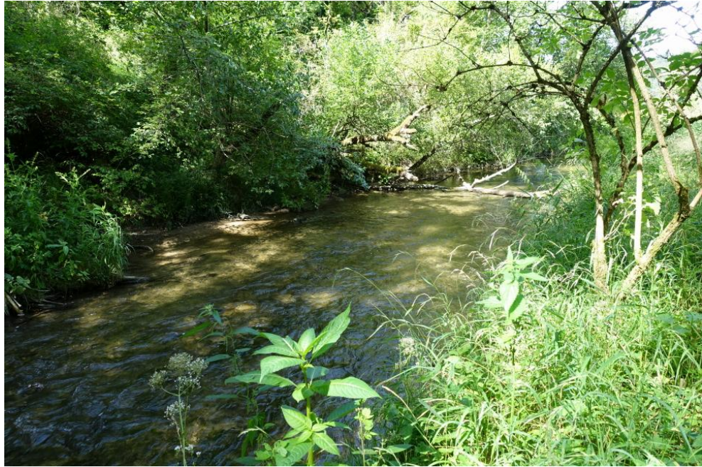
Foto 19 Schönach im Osten von Hohenfurch, Blickrichtung Nordost, 18.07.2022: Bachlauf im Ostabschnitt mit teilweise besonnter Wasserfläche und dichter krautiger Ufervegetation zwischen Laubgehölzen