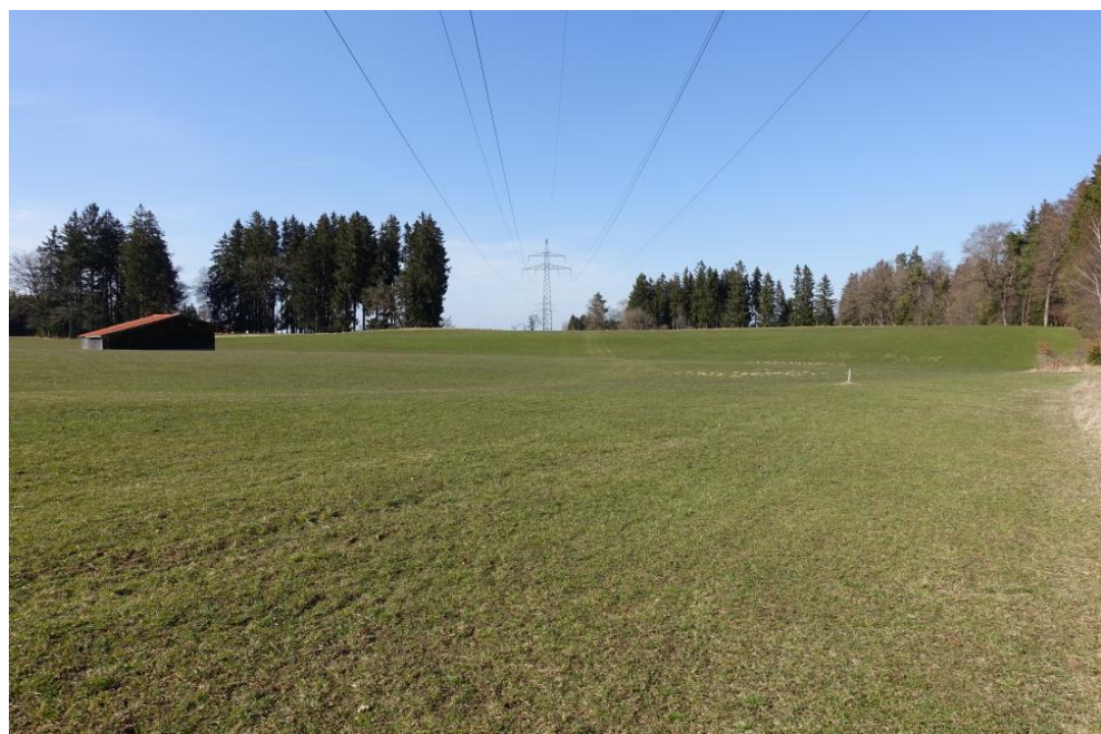
Foto 24 Abschnitt nordöstlich von Hohenfurch, Blickrichtung Nord, 26.03.2021: Grünland im Bereich „In der Lüsse“, in der Bildmitte Maststandort 46