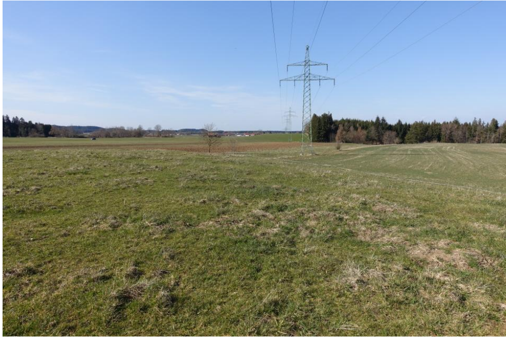
Foto 25 Abschnitt südlich Kinsau, Blickrichtung Nord, 26.03.2021: Grünland und Ackerflächen im Bereich „In der Lüsse“, in der Bildmitte Maststandort 47