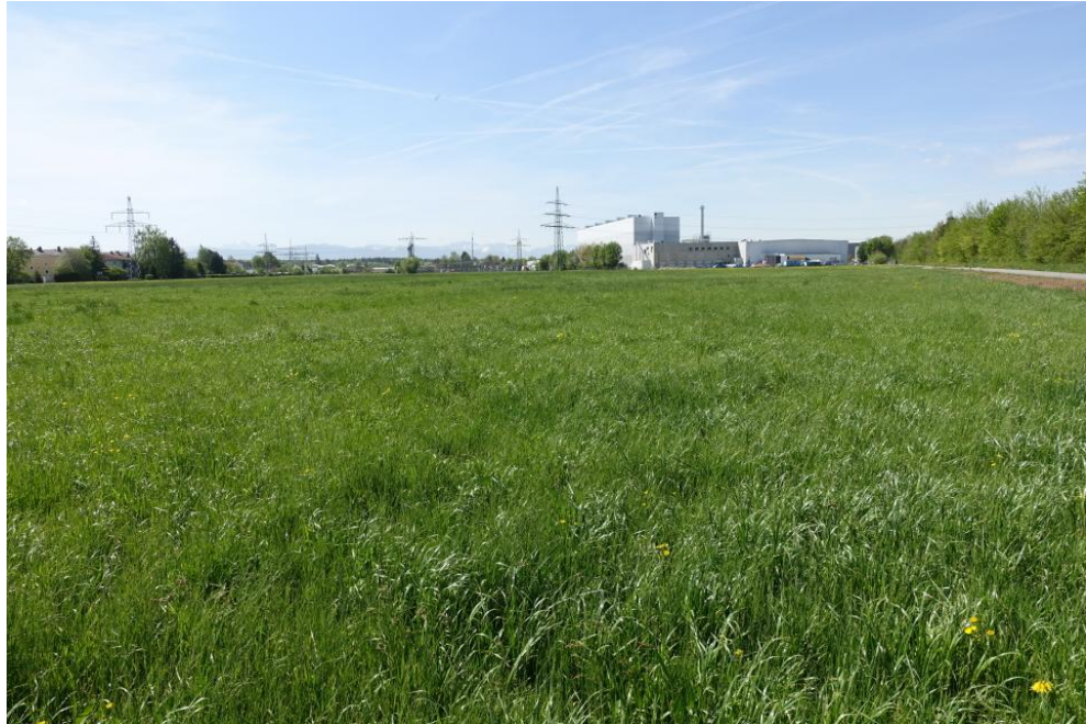
Foto 1 Freifläche im Norden des E-Werks bei Schongau, Blickrichtung Südwest, 11.05.2022: Im Vordergrund Fettwiesen, im Hintergrund links Siedlungsrand mit Maststandort 18, daneben E-Werk und Gewerbegebiet Lerchenfeld, rechts Hecke und Weg an der B 17