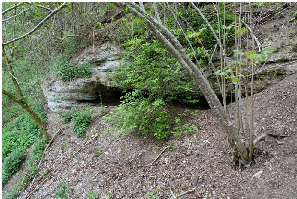
Foto 17 Felsnische an der Schönnach östlich Hohenfurch, 11.05.2021: Flache Höhle unter Felsblock am nördlichen Steilhang der Schönnach, südlich Kapelle, Ausschnitt aus Uhu-Brutrevier 15 (ASK), potenzieller Neststandort