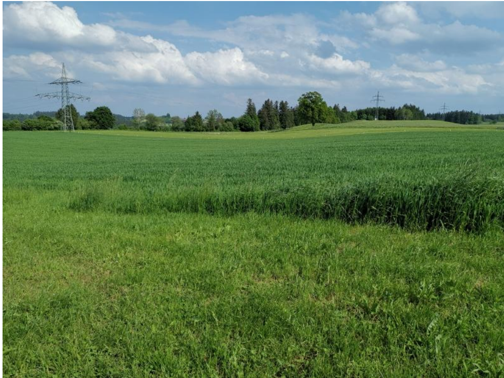
Foto 31 Abschnitt südlich Kinsau westlich „Sondhof“, Blickrichtung Südost, 26.05.2023: Im Vordergrund Intensivgrünland und Ackerflächen, im Hintergrund Gehölzreihe an Hangkante, links Maststandort 50 (Kreuzungsmast an Abzweigung)