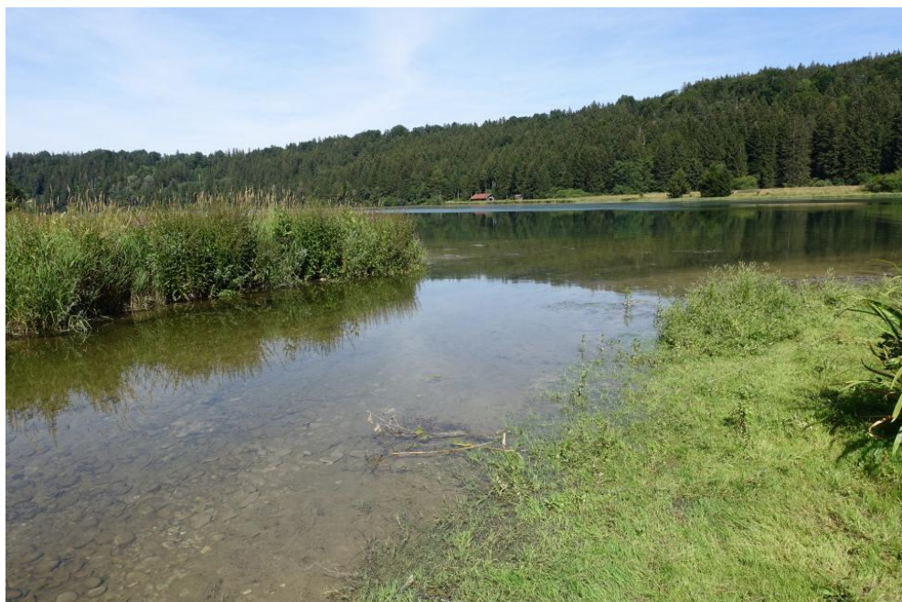
Foto 20 Schönach im Osten von Hohenfurch, Blickrichtung Nordost, 18.07.2022: Mündungsbereich in den Lech südlich Staustufe 8, im Vordergrund Flachwasserzone und Röhrichtbestand, Nahrungshabitat u. a. für den Eisvogel