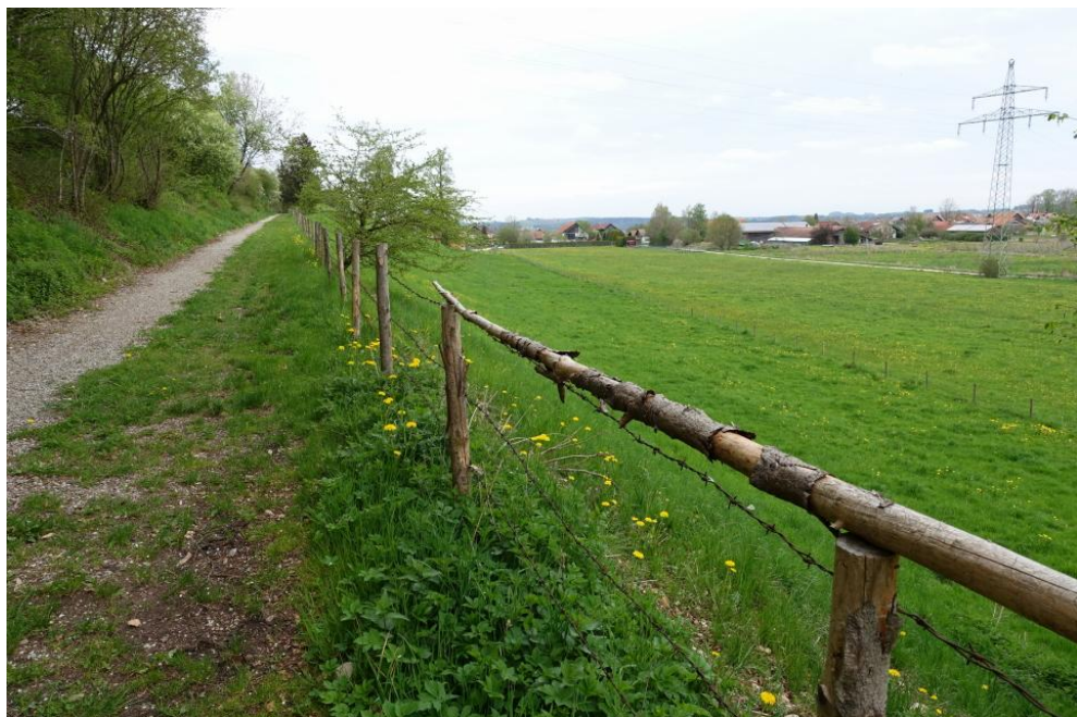
Foto 30 Abschnitt südlich Kinsau, Blickrichtung Nord, 11.05.2021: links Fußweg an Hangkante, rechts Wiesen und Pferdeweiden im Bereich „Sondhof“, am Bildrand rechts Maststandort 50/a1, im Hintergrund Kinsau