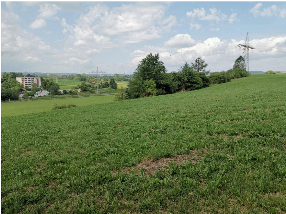
Foto 10 Abschnitt nördlich Krankenhaus Schongau, Blickrichtung Südwest, 19.07.2023: Im Vordergrund Fettwiese oberhalb des Hangs, in der Bildmitte Gehölzbestand und Maststandort 27, im Hintergrund links Krankenhaus und Bahnlinie mit Maststandort 26