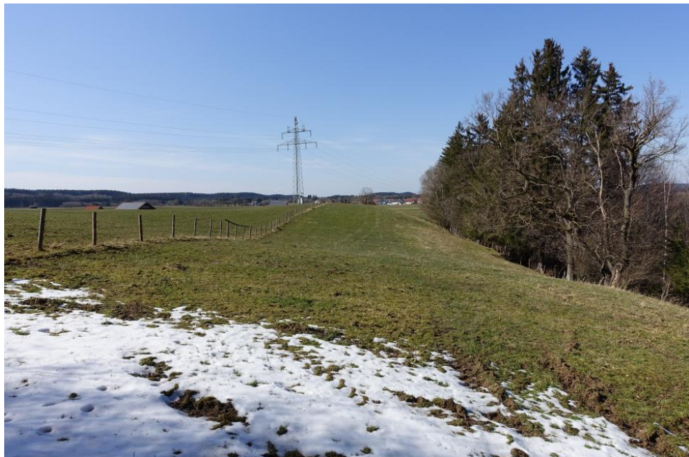
Foto 26 Abschnitt südlich Kinsau, Blickrichtung, 26.03.2021: Im Vordergrund beweidete Wiese neben Hangstufe mit Gehölzreihe, in der Bildmitte Maststandort 49, im Hintergrund Kinsau