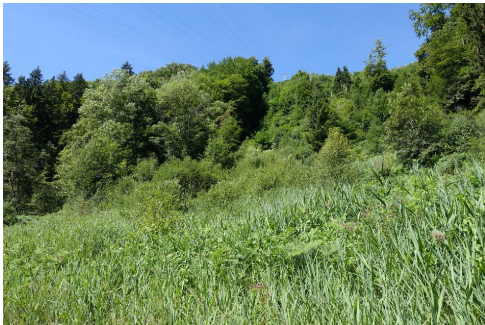
Foto 12 Stichleitung bei Lechstaustufe 7 (Rösenau), Blickrichtung West, 18.07.2022: Im Vordergrund staudenreiche Lichtung an Weg im Trassenabschnitt, dahinter Hangwald, im Hintergrund Maststandort 31/6 an der oberen Hangkante (Waldrand)