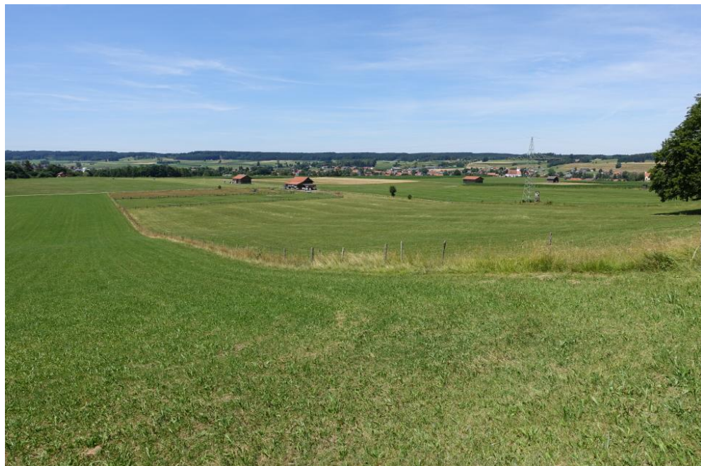
Foto 14 Abschnitt südöstlich Hohenfurch, Blick vom Waldrand Richtung Nordwest, 18.07.2022: Intensivgrünland und Ackerflächen mit einzelnen Ställen, in der Bildmitte rechts Maststandort 34, im Hintergrund Hohenfurch