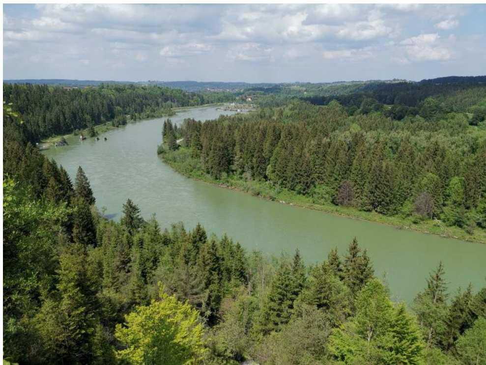
Foto 28 Lech im Süden der Staustufe 8a, Blickrichtung Nordost, 26.05.2023: Im Vordergrund bewaldeter Steilhang, rechts NSG Grünau