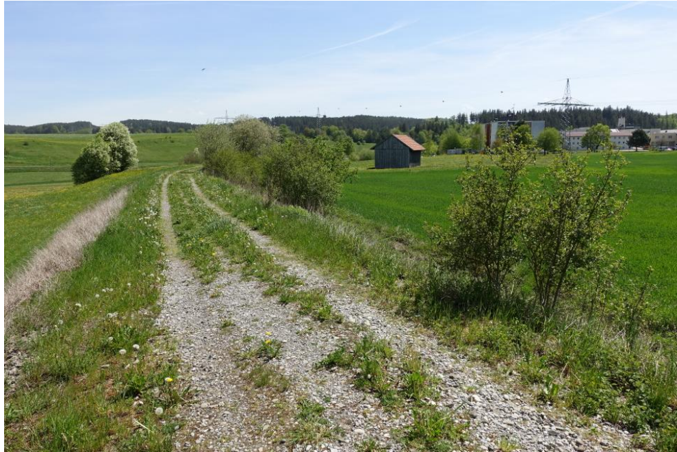
Foto 7 Ehemalige Bahnlinie im Norden von Schongau, Blickrichtung Ost, 11.05.2022: Im Vordergrund Schotterweg mit lückiger Heckenzeile, im Hintergrund rechts Krankenhaus und Maststandort 25