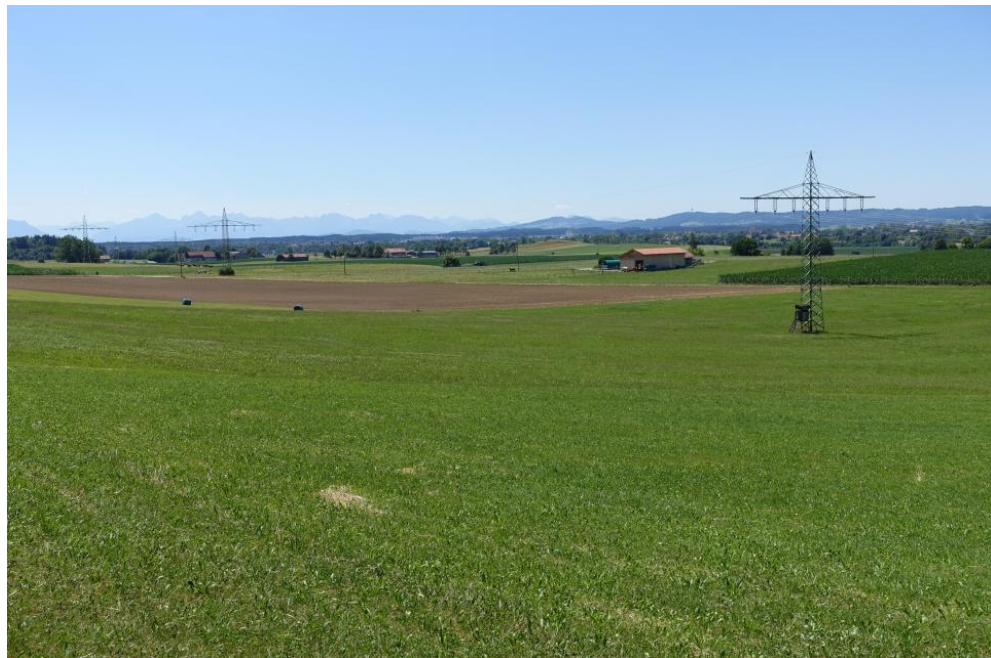
Foto 13 Abschnitt südöstlich Hohenfurch, Blick vom Waldrand Richtung Südwest, 18.07.2022: Intensivgrünland und Ackerflächen, im Vordergrund rechts Maststandort 33