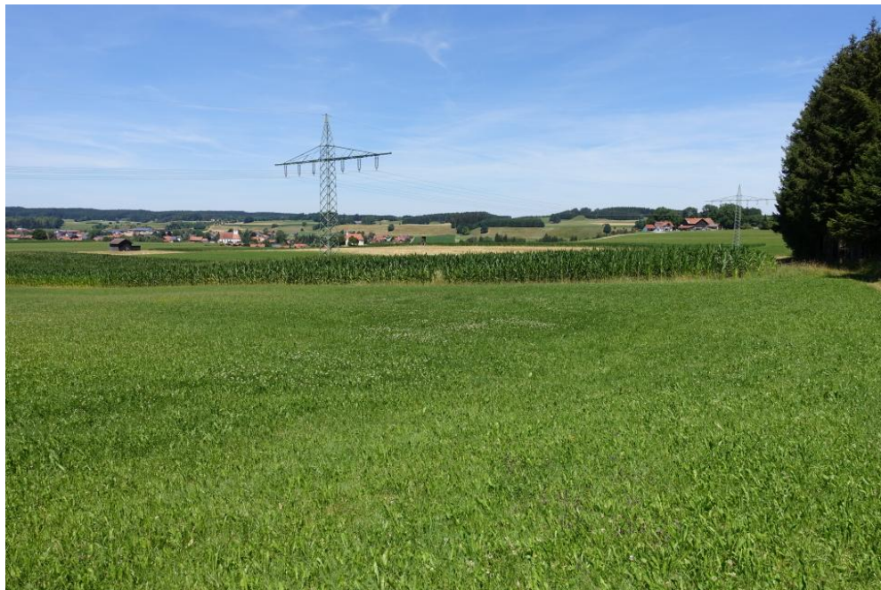
Foto 15 Abschnitt südöstlich Hohenfurch, Blickrichtung Nordwest, 18.07.2022: Im Vordergrund Fettwiese, dahinter Maisacker und Maststandort 36, rechts Fichtenbestand am Waldrand (Liberalswald), im Hintergrund links Hohenfurch, rechts Einzelgehöft an der Kapellenstraße