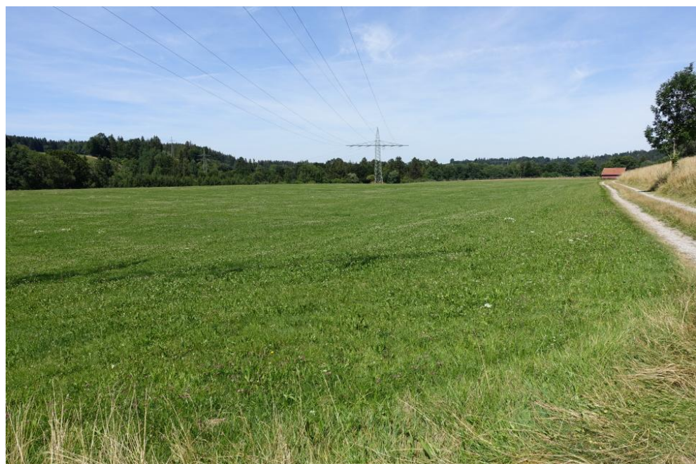
Foto 16 Abschnitt östlich Hohenfurch, Blickrichtung Nordost, 18.07.2022: Im Vordergrund Intensivgrünland, rechts Feldweg an Böschung mit Altgrasbestand, in der Bildmitte Maststandort 40, im Hintergrund Waldstreifen an der Schönach