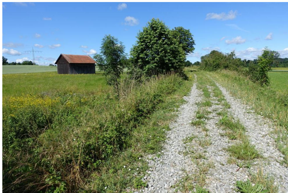
Foto 8 Ehemalige Bahnlinie im Norden von Schongau, Blickrichtung West, 25.06.2022: Schotterweg mit verbrachter Böschung und lichtem Gehölzsaum, Nachweise u. a. von Goldammer und Feldsperling