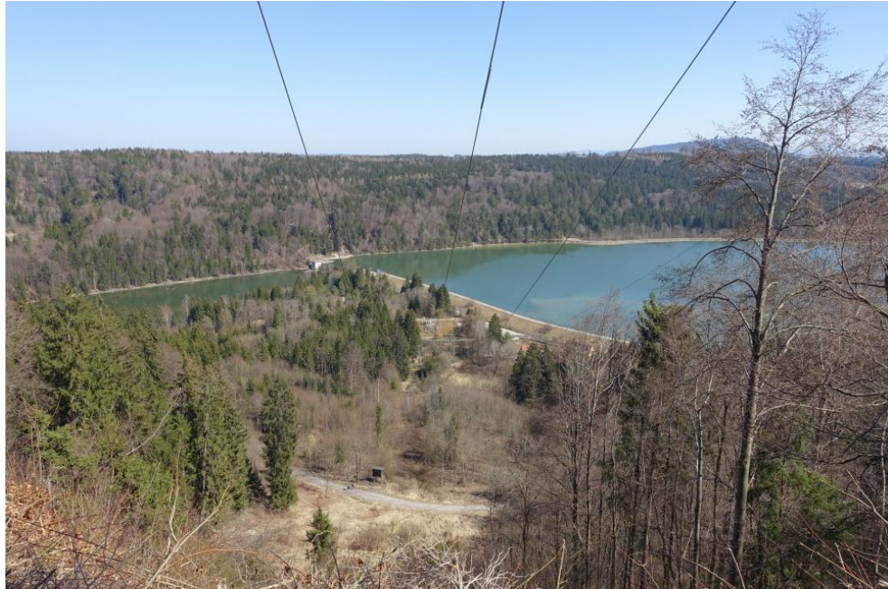
Foto 11 Stichleitung bei Lechstaustufe 7 (Rösenau), Blickrichtung Ost, 31.03.2021: Im Vordergrund Hangwald mit Schneise im Trassenbereich, in der Bildmitte Waldweg mit Lichtung und Kanzel am Hang, im Hintergrund rechts Staustufe und Siedlung Rösenau