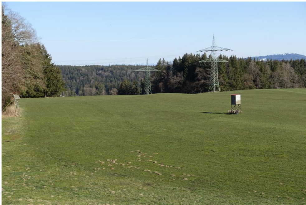
Foto 22 Abschnitt nordöstlich von Hohenfurch, Blickrichtung Südost, 26.03.2021: Im Vordergrund Fettwiese, dahinter Schneise der Stichleitung zur Staustufe 8, in der Bildmitte rechts Maststandort 43 (Kreuzungsmast an Abzweigung), daneben links Maststandort 43/2