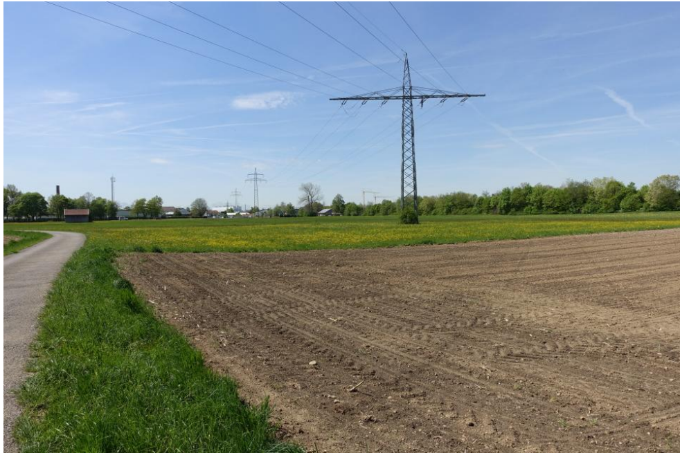
Foto 3 Grünfläche im Nordwesten von Schongau, Blickrichtung Südwest, 11.05.2022: Im Vordergrund Acker und Fettwiese südlich Eichenweg, in der Bildmitte Maststandort 22, im Hintergrund rechts Hecke an der B 17