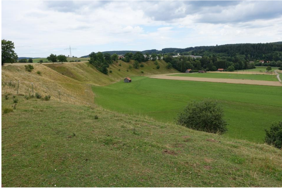
Foto 5 Prallhang und Talsohle im Norden von Schongau, Blickrichtung Nordost, 31.07.2022: Im Vordergrund beweideter Abschnitt der Böschung, dahinter Magerrasen mit eingestreuten Gehölzen, rechts Talfläche mit Wiesen und Ackerflächen, im Hintergrund Krankenhaus