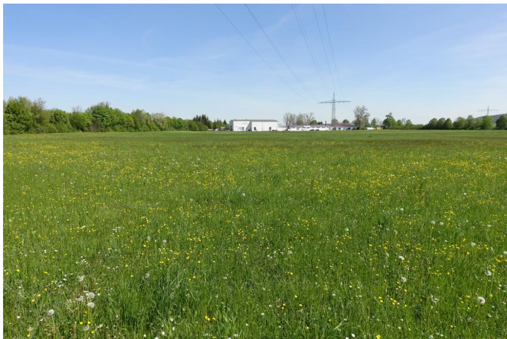
Foto 2 Grünfläche im Nordwesten von Schongau, Blickrichtung Nord, 11.05.2022: Im Vordergrund blühende Wiese nördlich der Altenstadter Straße, im Hintergrund Gewerbegebiet Eichenweg mit Maststandort 22, links Heckenzeile an der B 12