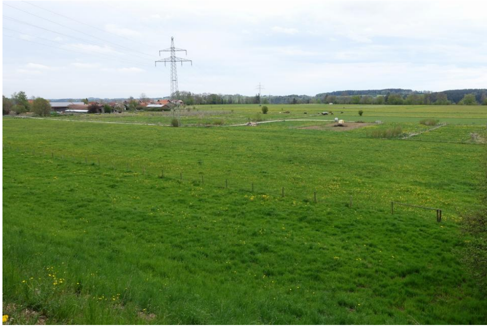
Foto 29 Abschnitt südlich Kinsau, Blickrichtung Nordost, 11.05.2021: Wiesen und Pferdeweiden im Bereich der Stichleitung zur Staustufe 8a („Sondhof“), in der Bildmitte Maststandort 50/a1