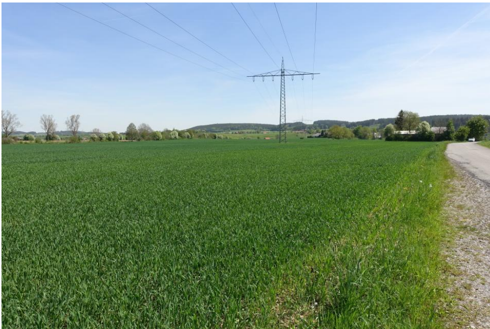
Foto 4 Domzeilfeld im Norden von Schongau, Blickrichtung Nordost, 11.05.2022: Im Vordergrund Ackerfläche, rechts Weg entlang Prallhang, in der Mitte Maststandort 24