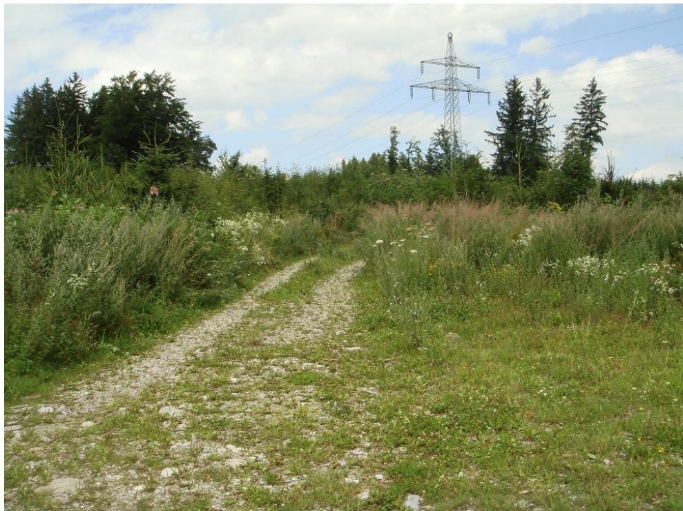
Foto 27 Aufforstungsfläche nördlich Hohenfurch, Blickrichtung Nordost, 29.07.2021: Kiesweg mit Schlagflur neben Schonungen, im Hintergrund Maststandort 45, Nachweise u. a. von Neuntöter, Goldammer und Erlenzeisig