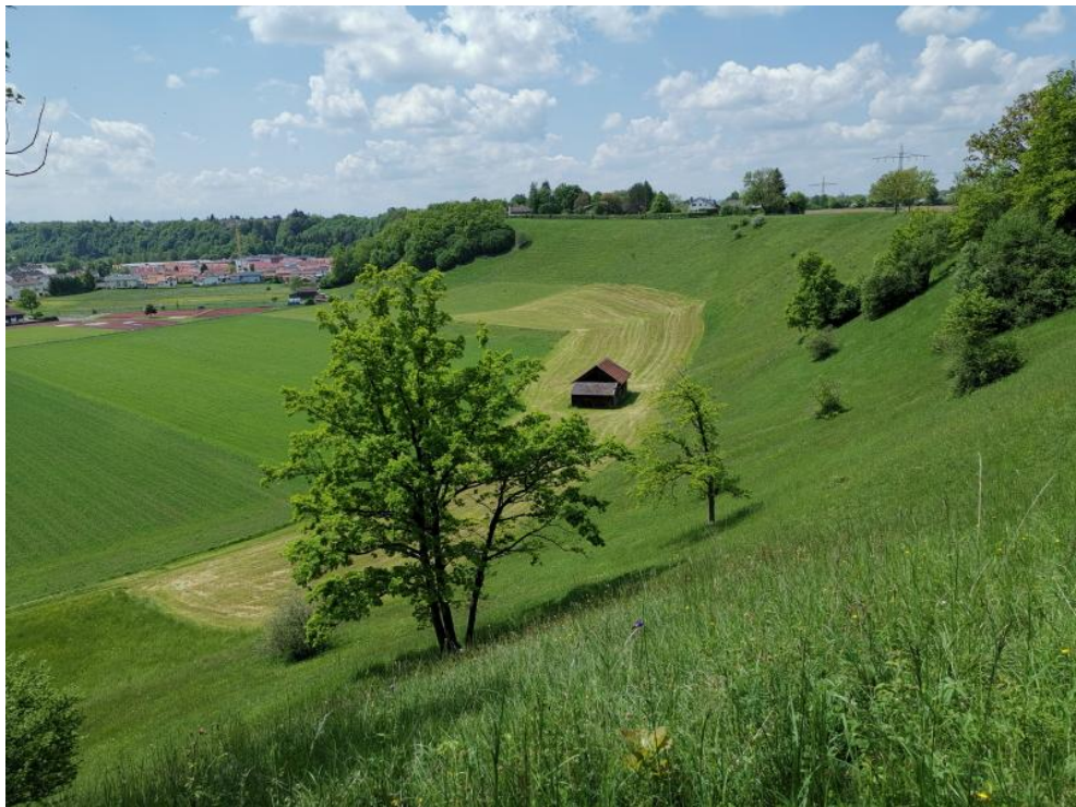
Foto 6 Prallhang und Talsohle im Norden von Schongau, Blickrichtung Südwest, 26.05.2023: Im Vordergrund rechts magere Böschung mit Einzelbäumen und -büschen, links Talsohle mit Grünland, Ackerflächen und Sportanlagen