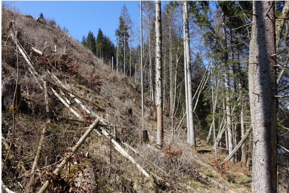
Foto 21 Hangwald bei Staustufe 8 nordöstlich Hohenfurch, Blickrichtung Nordwest, 26.03.2021: Durch Sturmschäden und Borkenkäferbefall stark gelichteter Altfichtenbestand mit vereinzelt Laubgehölzen (Buche) nordwestlich des E-Werks