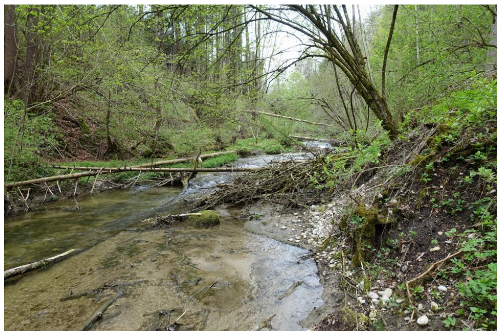
Foto 18 Schönnach im Osten von Hohenfurch, Blickrichtung West, 11.05.2021: Bachlauf in Schlucht mit bewaldeten Steilhängen, Uhu-Brutrevier 15 (ASK)