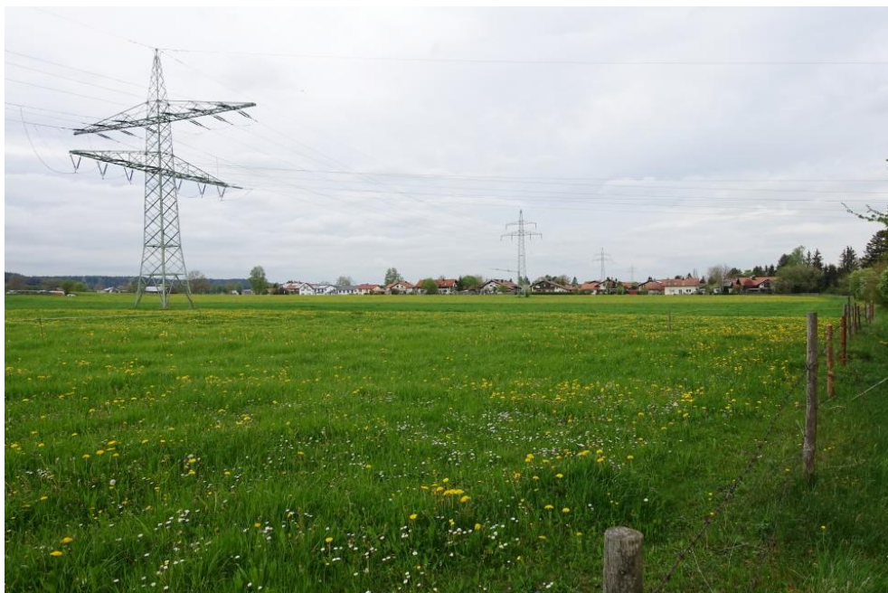
Foto 32 Abschnitt südlich Kinsau westlich „Sondhof“, Blickrichtung Nord, 11.05.2021: Im Vordergrund Intensivgrünland und Ackerflächen, rechts Weidezaun an der Hangkante, links Maststandort 50 (Abzweigung der Stichleitung zur Staustufe 8a)