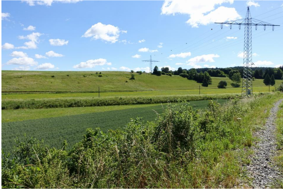
Foto 9 Abschnitt nördlich Krankenhaus Schongau, Blickrichtung Nordost, 25.06.2022: Im Vordergrund rechts Schotterweg an ehemaliger Bahnlinie mit Maststandort 26, links Wiesen und Ackerflächen, in der Bildmitte Bahnlinie (Güterverkehr), im Hintergrund Hang mit Maststandort 27