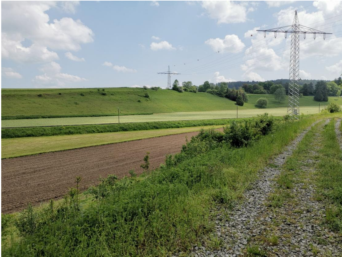
Trassenabschnitt im Norden von Schongau, Blickrichtung Nordost, 26.05.2023

Auftraggeber: Eger & Partner Büro für Landschaftsökologie Austraße 35 86153 Augsburg